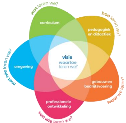
Figuur 1: Whole School Approach

Het curriculum is samenhangend en contextrijk: samenhang kan bijdragen aan betekenisvol onderwijs doordat verbindingen ontstaan tussen contexten, leergebieden, vakken en beroepenvelden. De drie benoemde speerpunten zijn geen losstaande elementen, maar zichtbaar in het gehele curriculum.