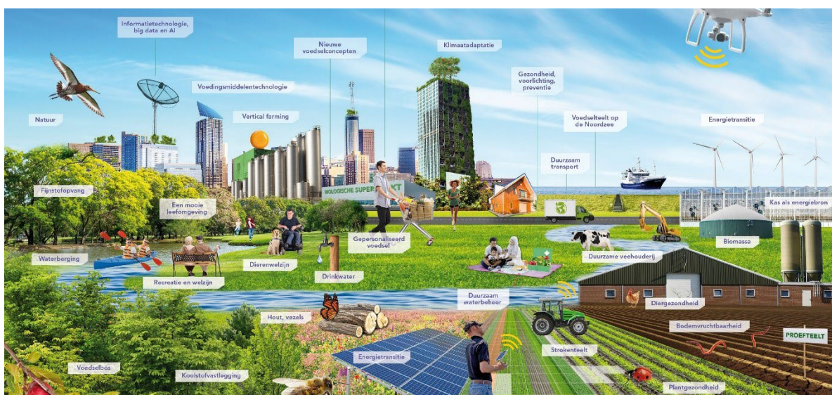
De 8 werelden van groen (Groenpact)

Een start in 2018 heeft het Goud Groene Carrièrepad een duidelijk vervolg gekregen in 2019. De doorlopende leerlijn van primair onderwijs tot en met hoger onderwijs is zichtbaar gemaakt door middel van allerlei projecten. Enkele voorbeelden: Het vervolg van het DNL traject, Sterk Techniek Onderwijs, het POVO-traject Gelijke Kansen, de profilering van het Groen door de inzet van de 8 werelden van Groenpact, de inrichting/uitbreiding van keuzevakken in ons onderwijs en een meer prominente voorlichting van ons eigen mbo. Een leerling krijgt zo beter inzicht in de gouden toekomst van het groen. Het wordt hierdoor tastbaar en merkbaar.