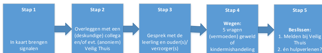
Figuur 1: Stappen van de Meldcode

De vijf stappen uit de Meldcode huiselijk geweld en kindermishandeling zijn (zie figuur 1):